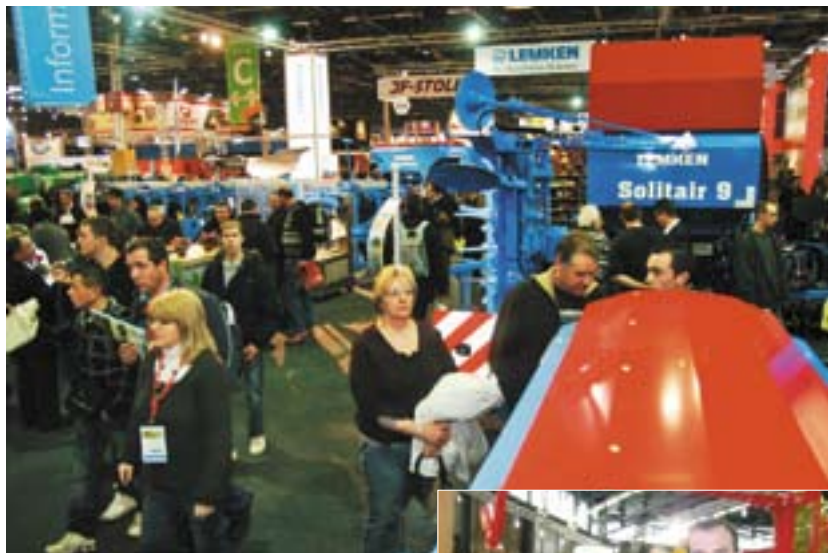
Sur le stand Lemken, 900m 2 étaient consacrés à l'exposition du matériel.

■ Pour beaucoup de constructeurs, ce SIMA 2009 qui s'est déroulé du 22 au 26 février dernier au Parc des Expositions de Villepinte, a été l'occasion de présenter les dernières nouveautés au public (voir PHR du 27 février). Pour d'autres en revanche, ce salon a surtout été un bon moyen de se préparer à la grande messe de l'agroéquipement Agritechnica qui se tiendra à Hanovre (Allemagne) du 10 au 14 novembre prochain. C'est notamment le cas du constructeur allemand Lemken qui n'a pas présenté d'exclusivités notoires, mais plutôt des améliorations d'outils déjà existants. «On présente seulement ce que l'on peut vendre et qui est livrable comme la charrue DuraMax et les outils adaptés