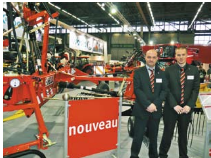
Le TS 880 nouveau turbo-andaineur de la marque FELLA est équipé d'un essieu tandem avec des pneus de 18/850-8 ce qui permet un andainage central et une bonne adaptation au sol dans les conditions extrêmes (comme l'andainage de la paille). Ses nouvelles roues lui permettent également une excellente stabilité lors du transport du route comme au travail.