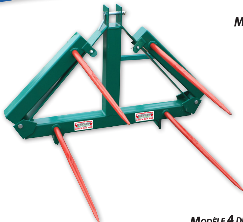
MODÈLE 4 DENTS DÉPLIABLE