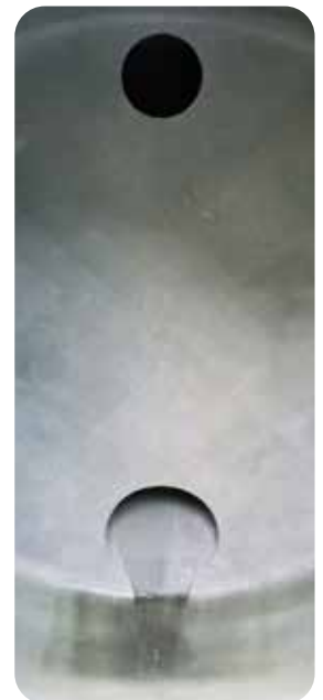
Brise-lames intérieur, évite le balancement de l'eau

BEISER Environnement Domaine de la Reidt • 67330 BOUXWILLER