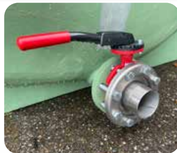
Vanne inox 3"