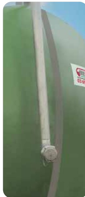
Tube de remplissage en 3" à hauteur d'homme en inox avec clapet anti-retour (option)