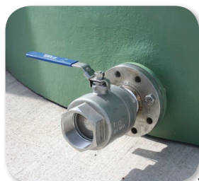
Bride de vidange avec vanne inox 316 et raccord pompier 3"

Dalle béton (doit être lisse, très propre et de niveau)