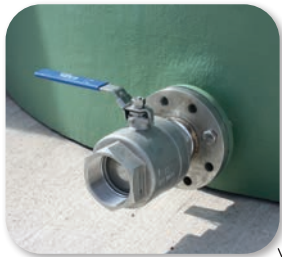
Bride de vidange avec vanne inox 316 et raccord pompier 3"

Dalle béton (doit être lisse, très propre et de niveau)