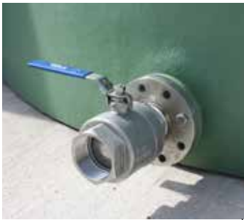
Bride de vidange avec vanne inox 316 et raccord pompier 3"