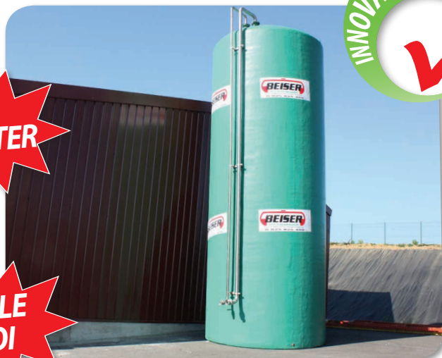
Encombrement au sol réduit : gain de place