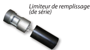
Limiteur de remplissage (de série)