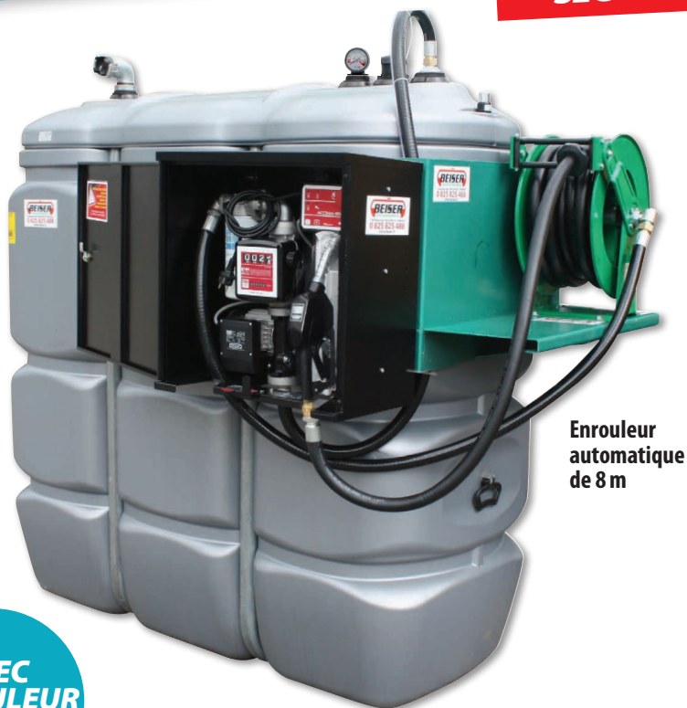
Enrouleur automatique de 8 m