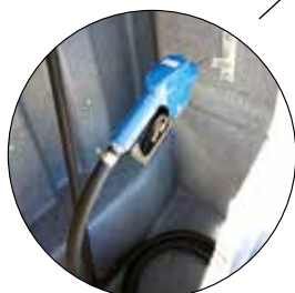
Enrouleur automatique 6 mètres