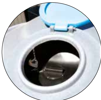
Accès trou d'homme de la citerne