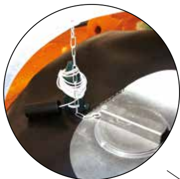
Jauge ultrasonique de niveau