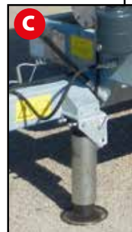
C Béquille hydraulique (option) Réf. 01039903003