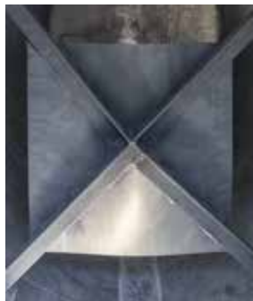
Brise-lames intérieur à partir de 5000 L