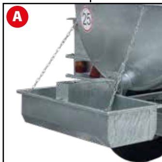
A Abreuvoir galvanisé (option) Réf. 01039904001