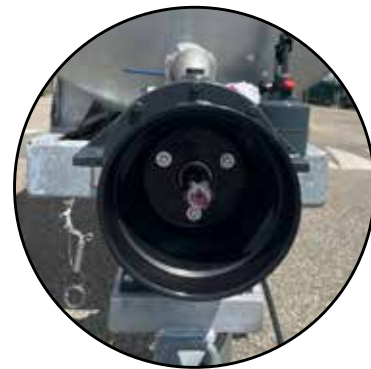
H Réf. 01990800208 Pompe à eau / engrais liquide auto-amorçant sur prise de force