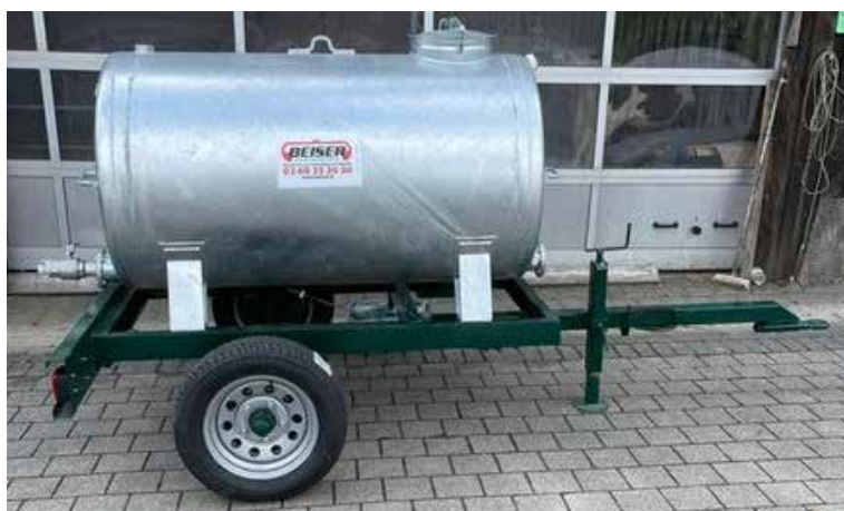
Version 1000 L