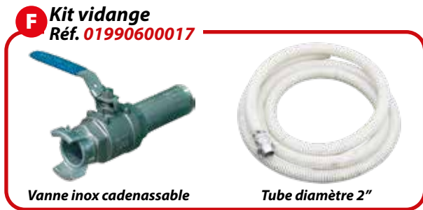
F Kit vidange Réf. 01990600017