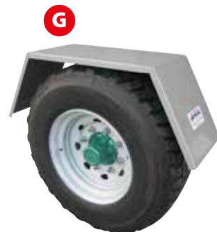
Garde boue galvanisé Dimensions : voir tableau ci-contre