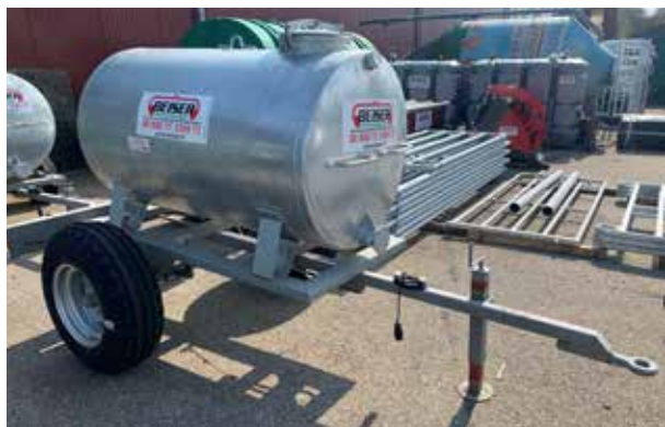
Version 1500 L

BEISER Environnement Domaine de la Reidt • 67330 BOUXWILLER