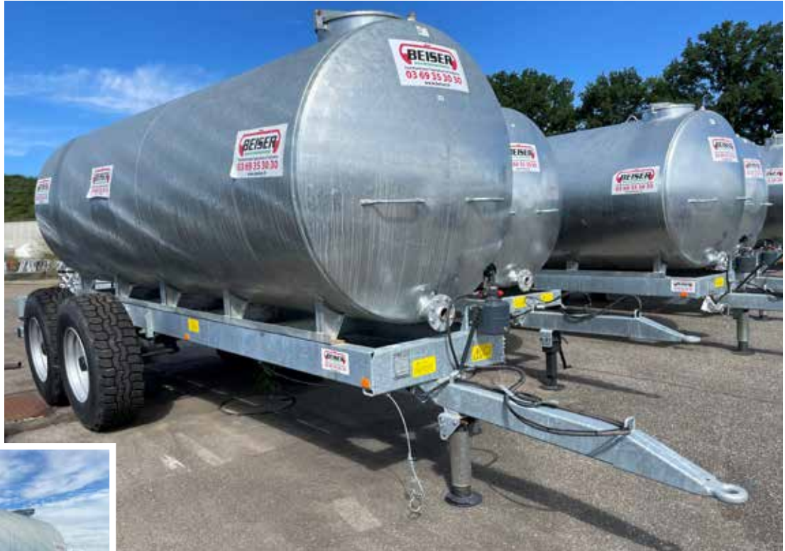
Version 10 000 L essieu balancier