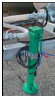
Béquille (de série)