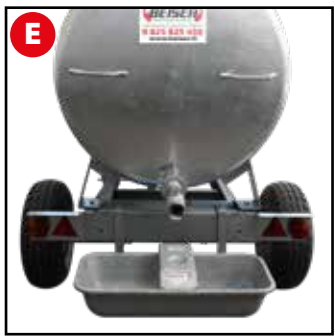
E Abreuvoir galva à niveau constant avec fixation spéciale mouton (option) Réf. 03080000023 / Fond à 50 cm du sol