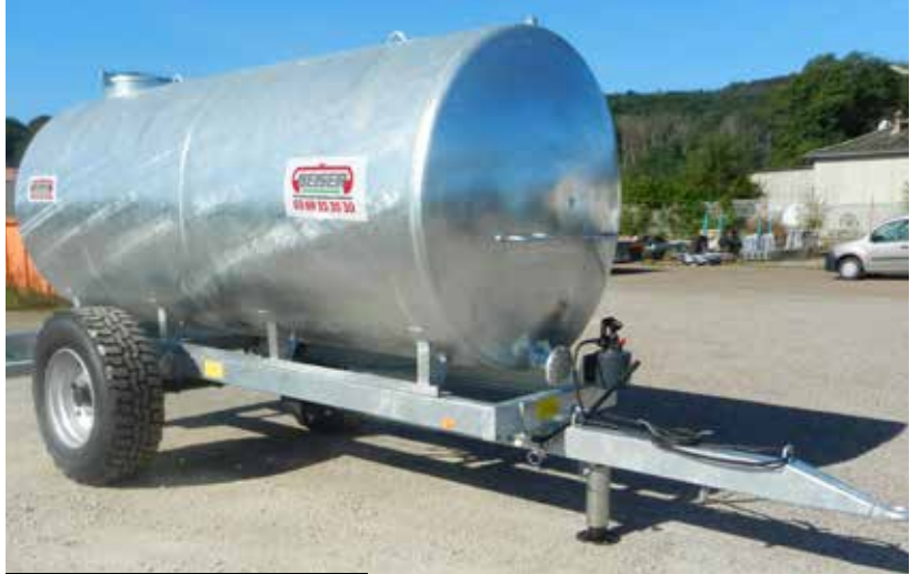
Version 6000 L - 8000 L - 10 000 L