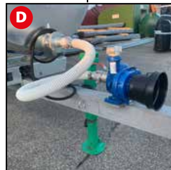
D Pompe à cardan (option) Réf. 01990800003