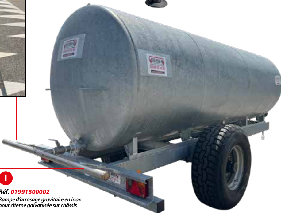
Réf. 01991500002 Rampe d'arrosage gravitaire en inox pour citerne galvanisée sur châssis

BEISER Environnement Domaine de la Reidt • 67330 BOUXWILLER