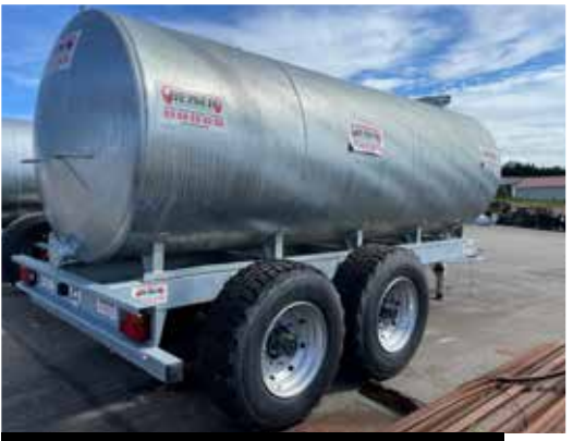
Version 10 000 L essieu balancier (vue arrière)

BEISER Environnement Domaine de la Reidt • 67330 BOUXWILLER