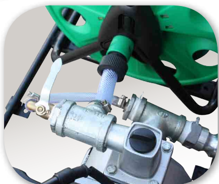
Système by-pass avec la vanne