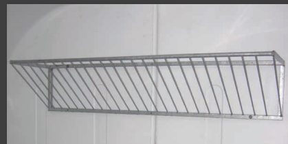
Râtelier intérieur (en option)