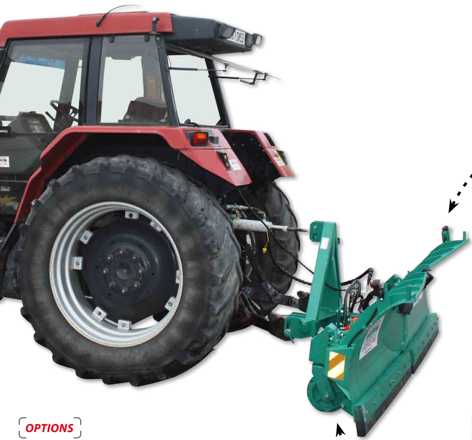
Lumière et porte-drapeau sur modèle 3 m