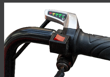
Sélecteur marche av/ar sur la poignée avec indicateur de charge

Poignée d'accélérateur avec sélecteur de marche