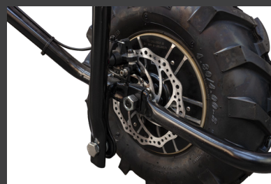
Frein à disque mécanique