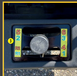
> Boîte de 6 vitesses (marche avant/arrière)