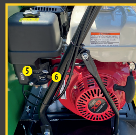
> Starter > Ouverture/fermeture carburant

BEISER Environnement • Domaine de la Reidt 67330 BOUXWILLER • Fax : 0 825 720 001