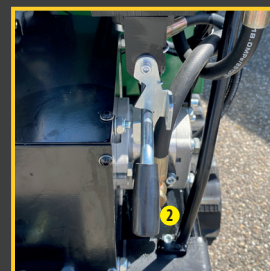
> Poignée de basculement de benne