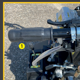
> Poignée de gaz, système de rotation (gauche/droite)