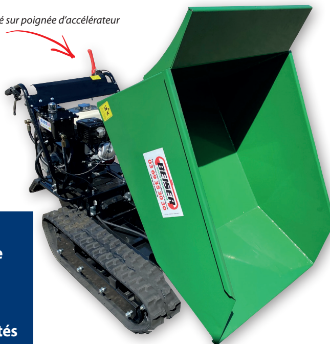
> Sécurité sur poignée d'accélérateur

➔ Plus robuste qu'une brouette et idéal pour transporter de lourdes charges