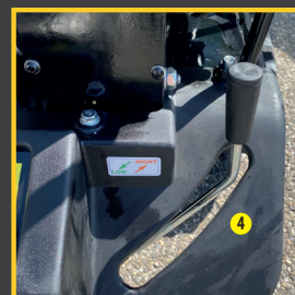
> Système de petite et grande vitesse