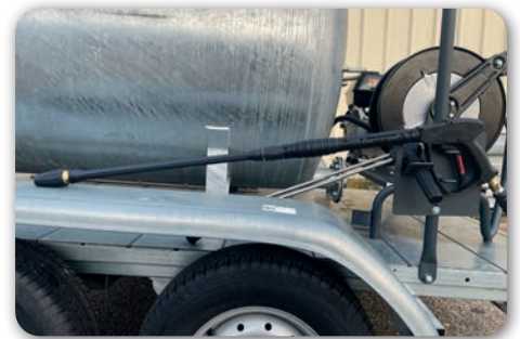
Lance double haute pression