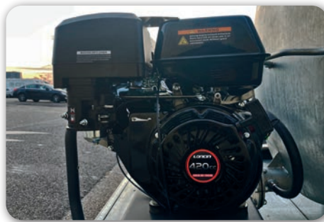
Moteur LONCIN 420cc