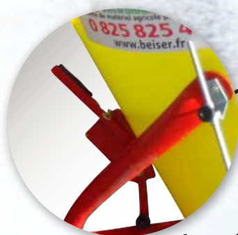
Commande qui assure l'ouverture et la fermeture de la trappe