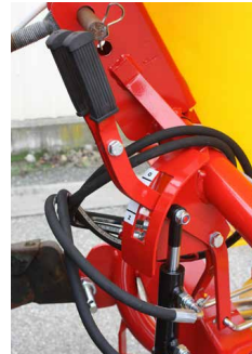
> Ouverture de la trappe hydraulique