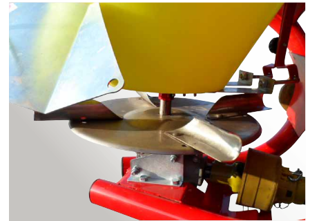
> Disque d'épandage inox (de série)