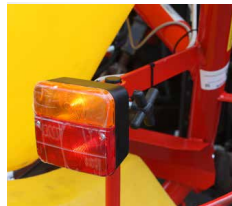
> Système d'éclairage de série