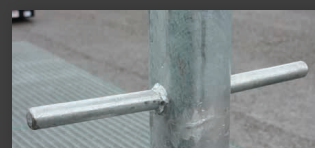
Poignées d'orientation de la potence (jusqu'à 180°)