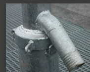
Raccordement de la potence en Ø 2"