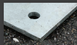
Dalle en fer d'épaisseur 10 mm avec points d'ancrage