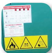
Kit signalisation Phytosanitaire de série