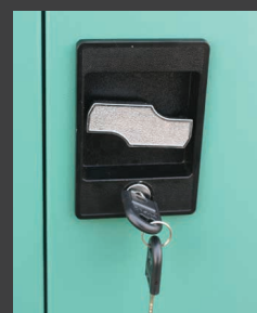
Fermeture à clé