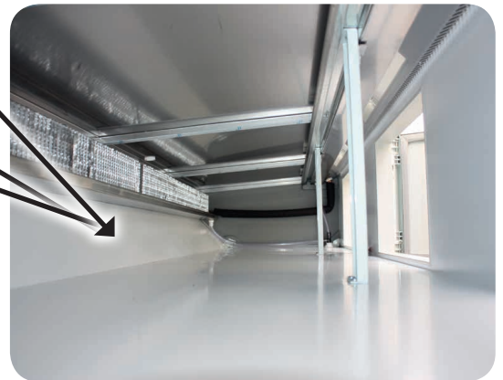
Réserve de stockage

BEISER Environnement • Domaine de la Reidt 67330 BOUXWILLER • Fax : 0 825 720 001