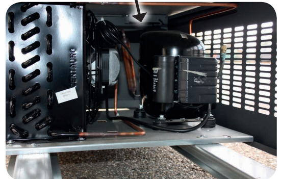
Groupe froid +3°C +6°C