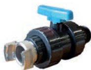
Vanne de vidange PVC 3" + raccord pompier (option)