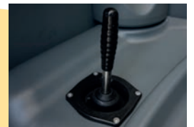
> Levier de la chasse d'eau