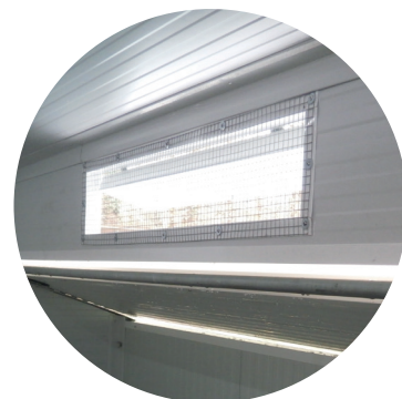
Aérations latérales à ouvertures rapides L 95cm x h 18 cm