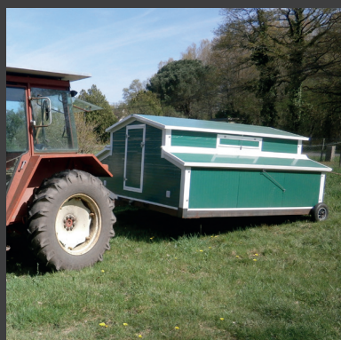
Facilement transportable grâce au KIT de déplacement (en option)