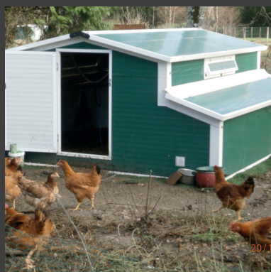
Bâtiment en situation