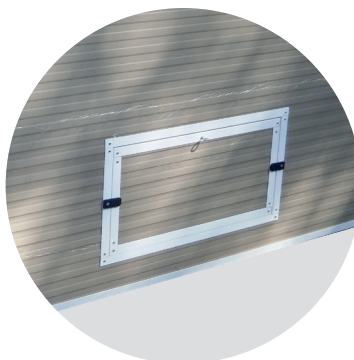
Trappe de sortie à l'arrière du bâtiment L 69 cm x h 34 cm

➔ Des portes style «hayon» permettent l'observation et le travail de l'éleveur sans entrer à l'intérieur