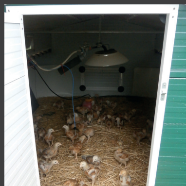
Conçu pour assurer le bien-être des animaux

BEISER Environnement • Domaine de la Reidt 67330 BOUXWILLER • Fax : 0 825 720 001