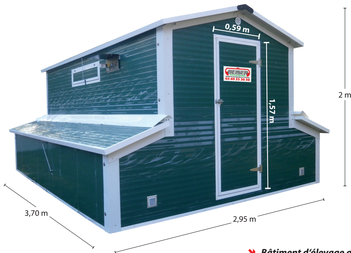
➔ Bâtiment d'élevage avicole "Mini" Modèle 2m