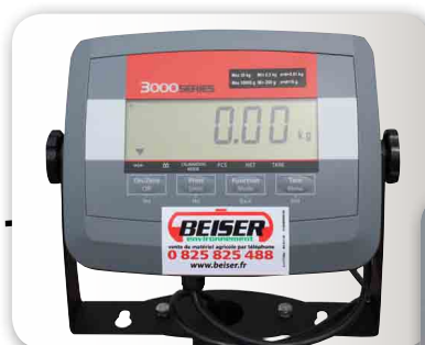
Indicateur de poids et contrôle LCD rétroéclairé