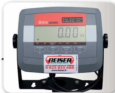
Indicateur de poids et contrôle LCD rétroéclairé