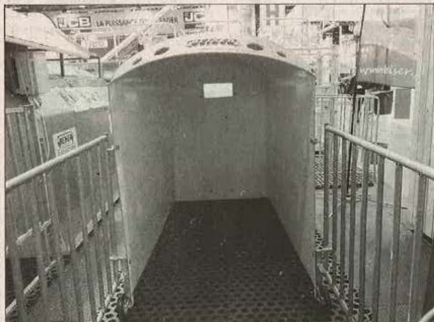
Sous cette couche d'isolant, les veaux seront bien au chaud dans leur niche.

Avec 700 m 2 de stand et une équipe de 25 personnes mobilisée pour répondre aux questions des visiteurs, établir des devis et signer des ventes, Beiser Environnement a une fois de plus affirmé sa position de partenaire privilégié des agriculteurs, et plus particulièrement des éleveurs.