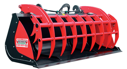
Ce godet pélican offre une grande polyvalence de travail.

BEISER environnement Fournisseur pour l'agriculture et l'industrie 0 825 825 488 www.beiser.fr