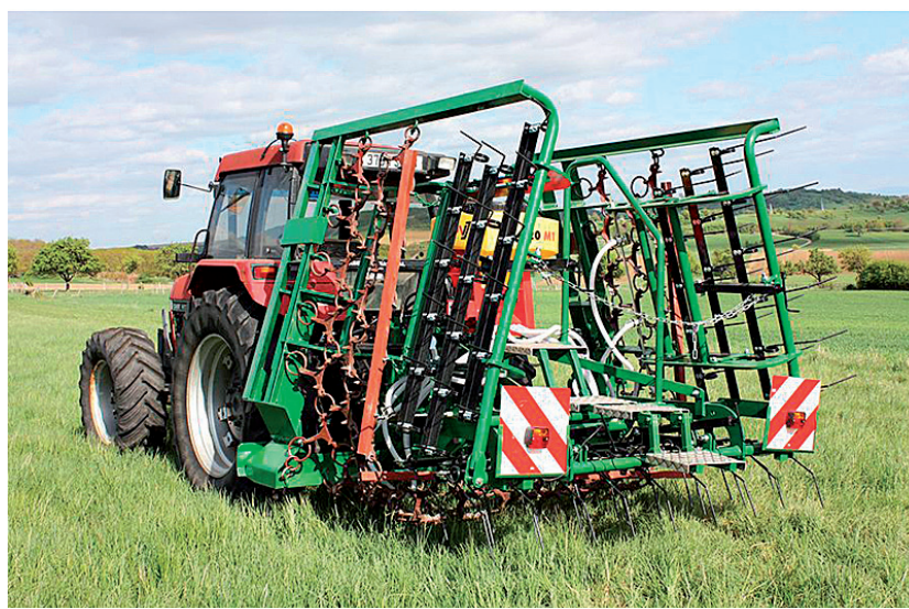
L'herse de prairie mixte existe en version 8m et 6m.

Cette herse s'avère l'outil idéal pour préparer les prairies. Que se soit pour niveler les taupinières, aplanir