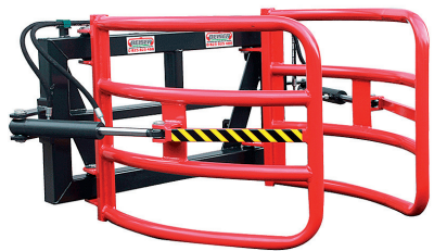
Cette pince permet une prise et une dépose facile des balles.