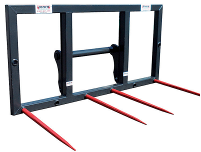
Ce cadre pique botte peut soulever des charges allant jusqu'à 800 kilos.

sécurité des intervenants, le couloir de contention permet de passer un nombre important d'animaux en peu de temps et en toute simplicité. Son caractère multi-usage (manipulation, soin, mais également pesée des animaux grâce à l'insertion inédite d'une cage de pesée allant de 50 à 2 000 kg,...) et son adaptabilité au cheptel de petite taille, en font un matériel incontournable. Sa simplicité et sa rapidité d'utilisation, avec notamment ses portes coulissantes de séparation, permettent d'intervenir rapidement et en toute sécurité sur un nombre important de bêtes. Avec son tapis antidérapant et son plancher intégrés sur toute sa surface et tout le long du couloir de 8,5 m de long (unique sur le marché!), les risques de blessures par glissade du cheptel sont amoindries et le bruit se trouve atténué, offrant un bien-être optimal à l'animal. Enfin, ses facilités de transport, avec notamment un système de relevage hydraulique, son treuil, ses sangles et son éclairage de série en font un produit complet et indispensable.