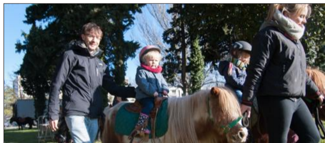
Une douzaine de poneys ont promené les enfants de moins de 10 ans.

Record battu ! De 10 heures à 16 heures, hier sur la pelouse du stade nautique de Saint-Chamand, l'élevage du Ranch des marais a effectué pas moins de 550 baptêmes de poney pour les enfants du quartier. Mais pas seulement. Alertées par la radio, plusieurs familles ont fait le déplacement jusqu'à St-Chamand. « Le but est de démocratiser l'équitation, de montrer que c'est abordable, indique Dominique Méjean d'Avignon Tourisme. Et dès qu'il y a un cheval, ça marche. C'est un vecteur super intéressant », souligne la responsable de l'événementiel du Parc Expos.