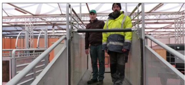
Les responsables du stand sur le tapis roulant d'entraînement.

250 stands vont être montés. Parmi les nouveautés 2017, une société strasbourgeoise présentera du matériel professionnel sur un stand de 225 m, le plus grand du salon. Les propriétaires de chevaux y trouveront même un tapis roulant d'entraînement. Des démonstrations auront lieu pendant la durée du salon.