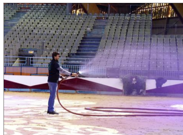
3 500 tonnes de sable sont utilisées pour Cheval Passion.